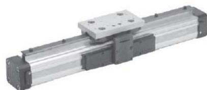
Модификация с кареткой качения