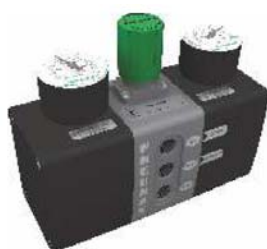
Исполнение с установленными манометрами