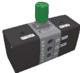
Исполнение 2R_ (базовое)