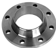
FF21-XXX 2 шт.