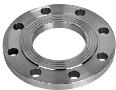
FF20-XXX 2 шт.