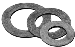
Прокладка паронитовая XXX 2 шт.