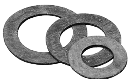
Прокладка паронитовая XXX 2 шт.